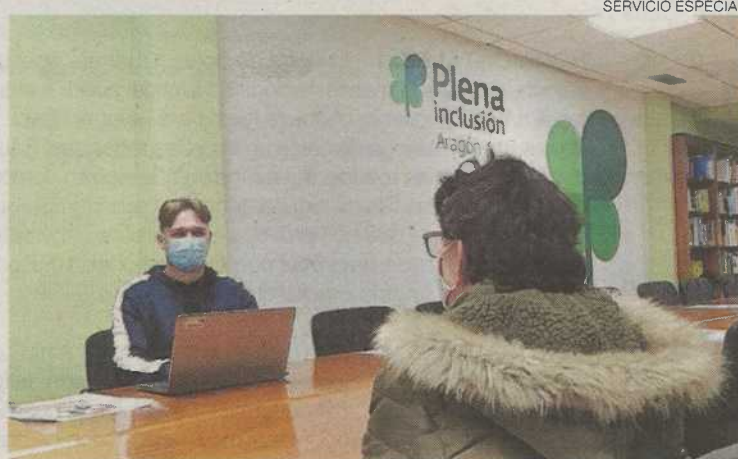
► Un profesional de Plena inclusión Aragón atiende a una usuaria.

chos solicitantes llevan meses esperando una resolución. Así que ahora se espera que la entrada de las entidades del tercer sector en la gestión de esta prestación agilice los trámites y permita desatascar una situación que afecta a miles de ciudadanos en situación de vulnerabilidad social.