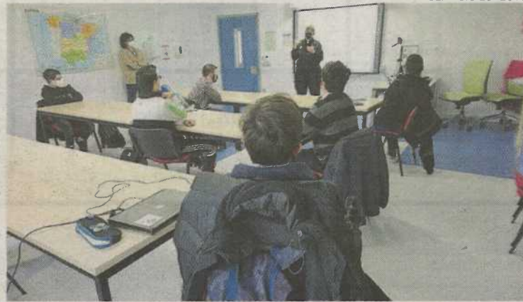
► La agente de la Policía Nacional impartiendo la charla a los jóvenes de los PCI.

La agente comenzó con dos de los consejos más importantes: actuar en las redes como lo haríamos en la calle y tener mucho cuidado con lo que compartimos. «Cuando